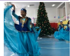
Благотворительное мероприятие для школьников - стр. 5