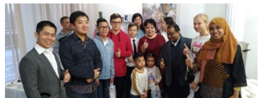
Переговоры с потенциальными инвесторами из Индонезии - стр. 3